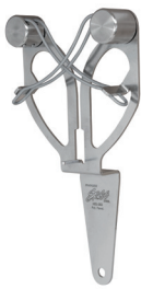
Można trzymać ją w ręku, prawo- lub leworęcznie

Stal nierdzewna jest odporna na korozję i rdzewienie. Odpowiednie procedury mycia i sterylizacji muszą być przestrzegane, aby zapewnić integralność stalowej Ergo Steel. Wybór metody i częstotliwości mycia zależy od specyfiki linii przetwórczej, produktu, który jest przetwarzany, ilości osadu, który zbiera się na stalce podczas pracy oraz wymogów higienicznych w danym zakładzie. Chemiczne środki do dezynfekcji są często bardziej żrące niż środki myjące, stąd zalecamy używanie ich z rozważeniem. Ze względu na dużą różnorodność dostępnych chemicznych środków do dezynfekcji, zdecydowanie zalecamy przeprowadzenie małej próby oddziaływania danego środka w normalnym stężeniu na stal nierdzewną przed przystąpieniem do czyszczenia nim stalowej Ergo Steel.