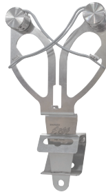
Można wsunąć pionowo do uchwyty na wysokości blatu roboczego