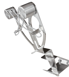
Można wsunąć pod kątem do uchwyty powyżej blatu roboczego